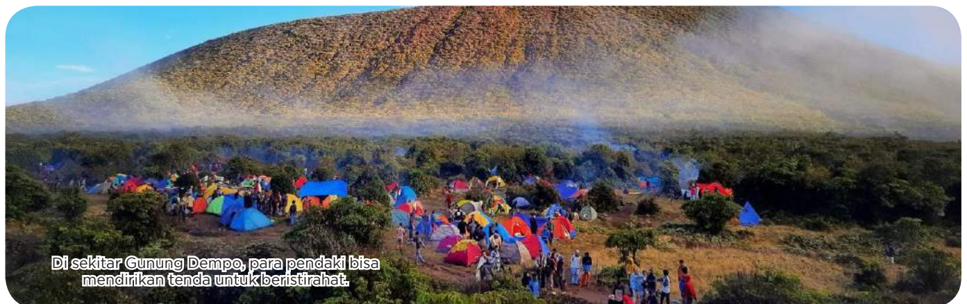
Di sekitar Gunung Dempo, para pendaki bisa mendirikan tenda untuk beristirahat.