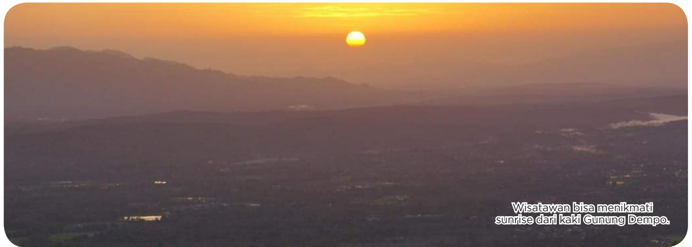
Wisatawan bisa menikmati sunrise dari kaki Gunung Dempo.