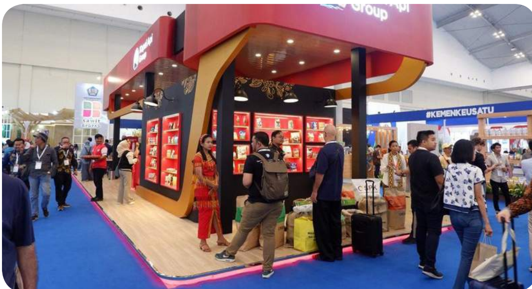
Pengunjung melihat produk dari Kapal Api Group dalam Trade Expo Indonesia (TEI) 2023 yang mengusung tema Sustainable Trade for Global Economic Resilience.