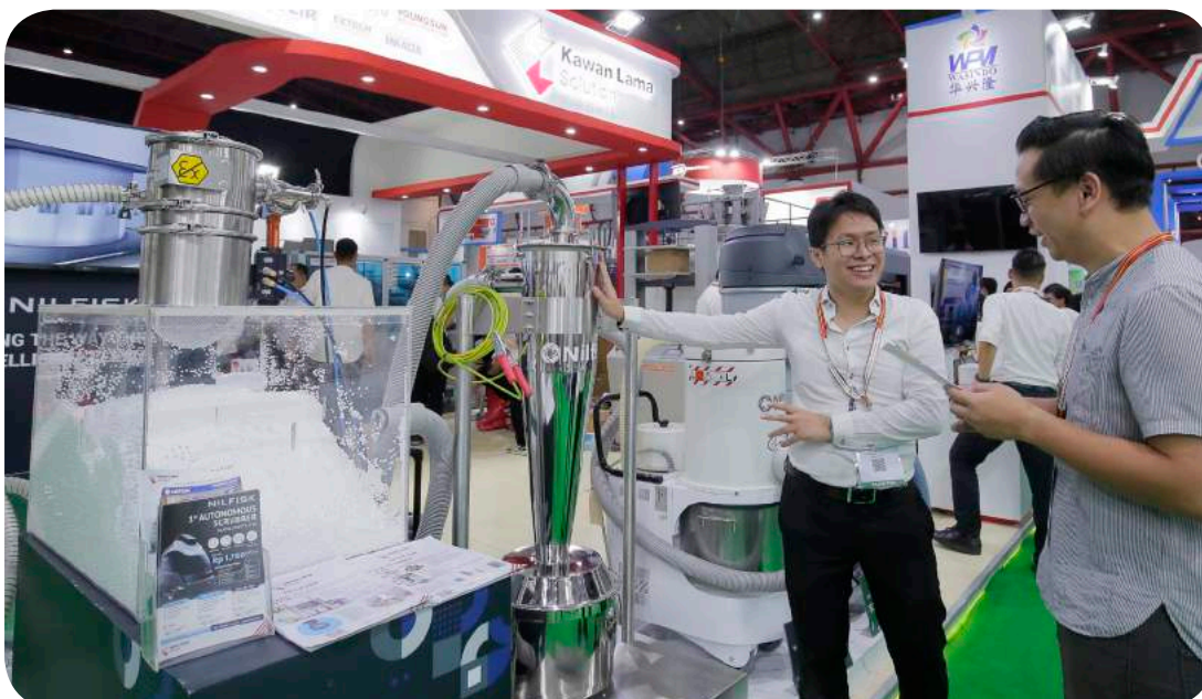
Kawan Lama Solution memperkenalkan rangkaian solusi teknologi terdepan dalam pameran AllPack Indonesia 2023 di Jakarta International Expo, Kemayoran, Jakarta pada 11-14 Oktober 2023.

Untuk diketahui Allpack Indonesia tahun merupakan gelaran ke-22 sementara Allprint Indonesia merupakan pameran ke-24. Peserta pameran berasal dari 19 negara, yaitu Indonesia, Singapura, Malaysia, Jepang, Vietnam, Korea Selatan, India, Jerman, Prancis, Italia, Tiongkok, Austria, India, Taiwan, Thailand, Inggris, Australia, Kanada, dan Amerika. (en)