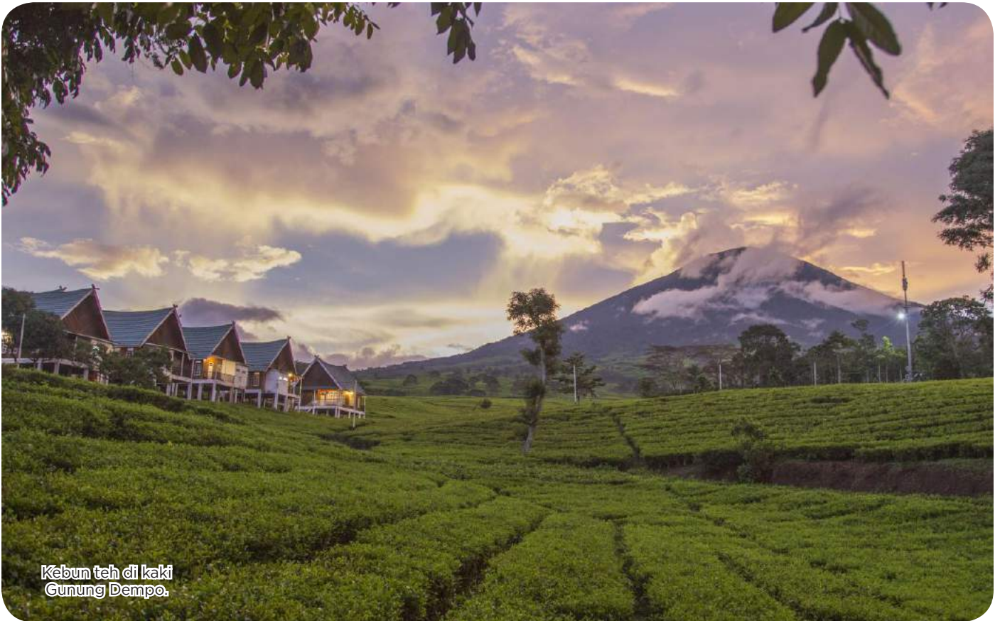
Kebun teh di kaki Gunung Dempo.