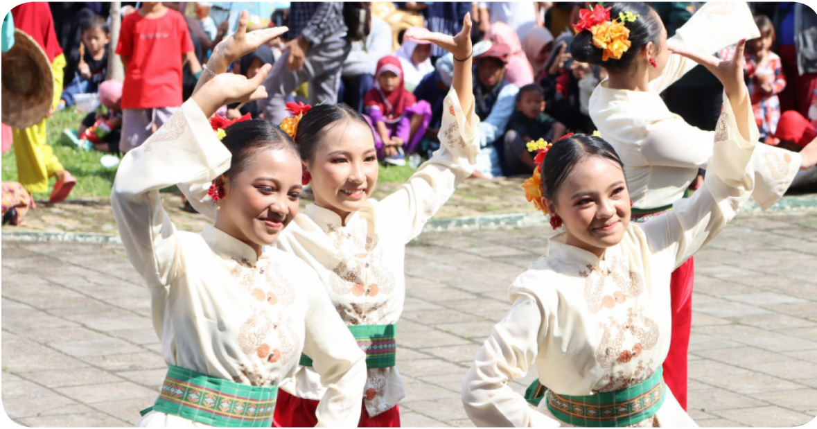
Penampilan peserta Kirab Budaya di Kedaton Kesultanan Kutai Kartanegara Tenggarong, Minggu (9/7/2023).