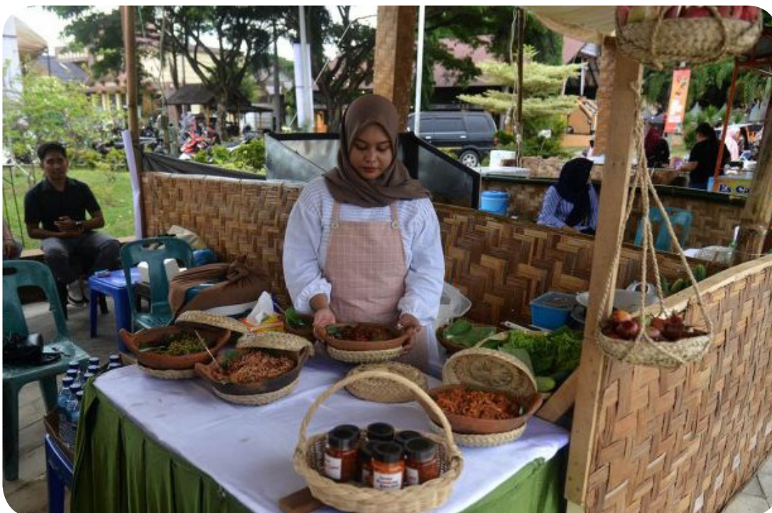
Peserta yang mengikuti Aceh Culinary Festival 2022 di Taman Sulthanah Safiatuddin, Kota Banda Aceh