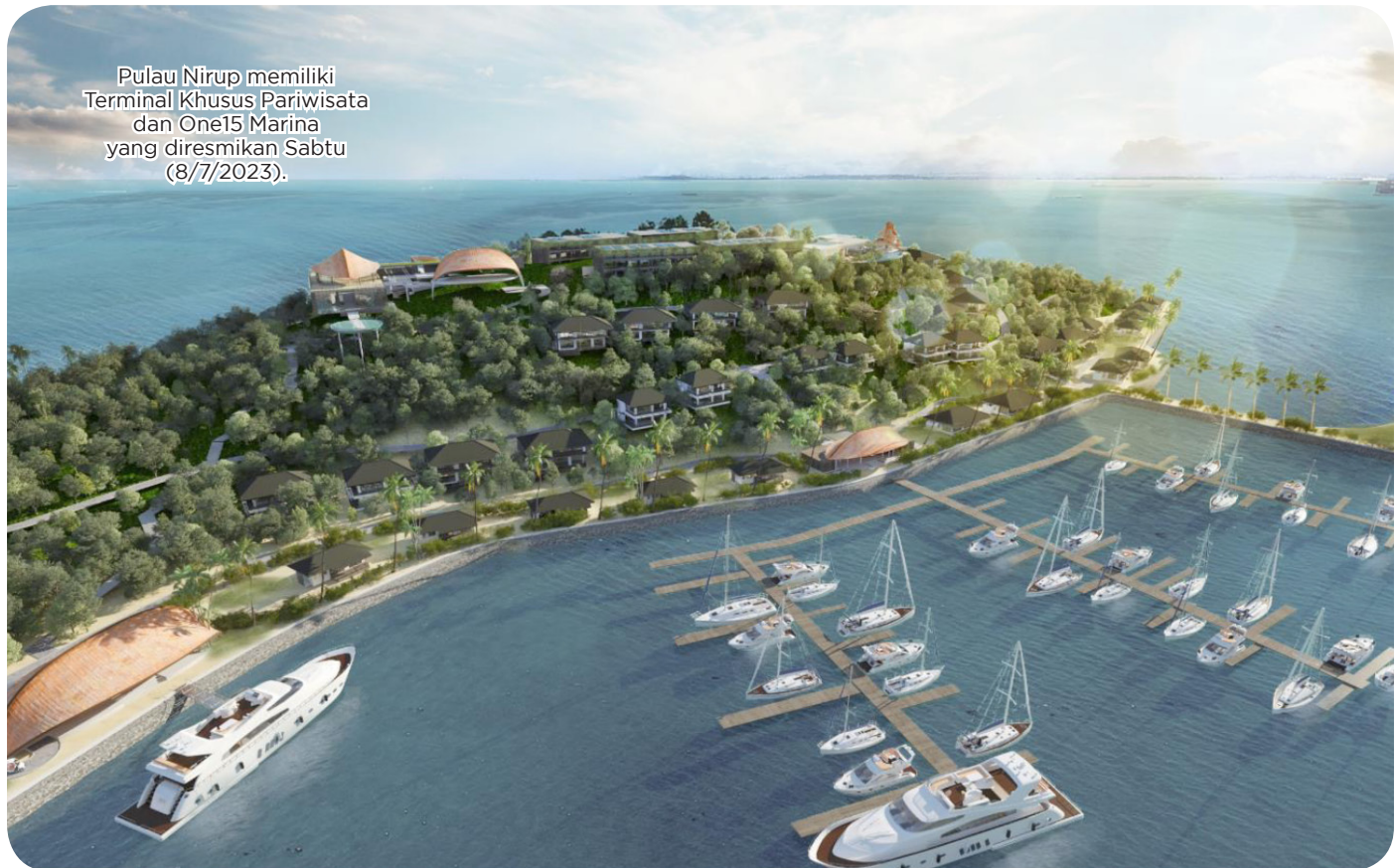
Pulau Nirup memiliki Terminal Khusus Pariwisata dan One15 Marina yang diresmikan Sabtu (8/7/2023).