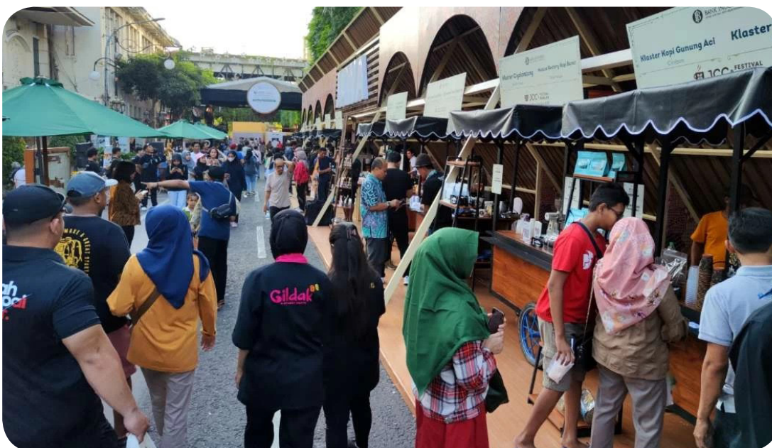
Java Coffee Culture 2023 di Jalan Tunjungan, Surabaya, Minggu (9/7/2023).

Filianingsih menjelaskan, produksi kopi di Jawa pada 2022 tercatat 99 ribu ton, dan didominasi dari Jatim, Jawa Tengah, dan Jawa Barat. Terbanyak di wilayah Jatim, yaitu menghasilkan 45 ribu ton kopi. Di Pulau Jawa katanya, komoditas kopi roasted masih didominasi Jatim dan komoditas ekstrak kopi didominasi Banten. (en)