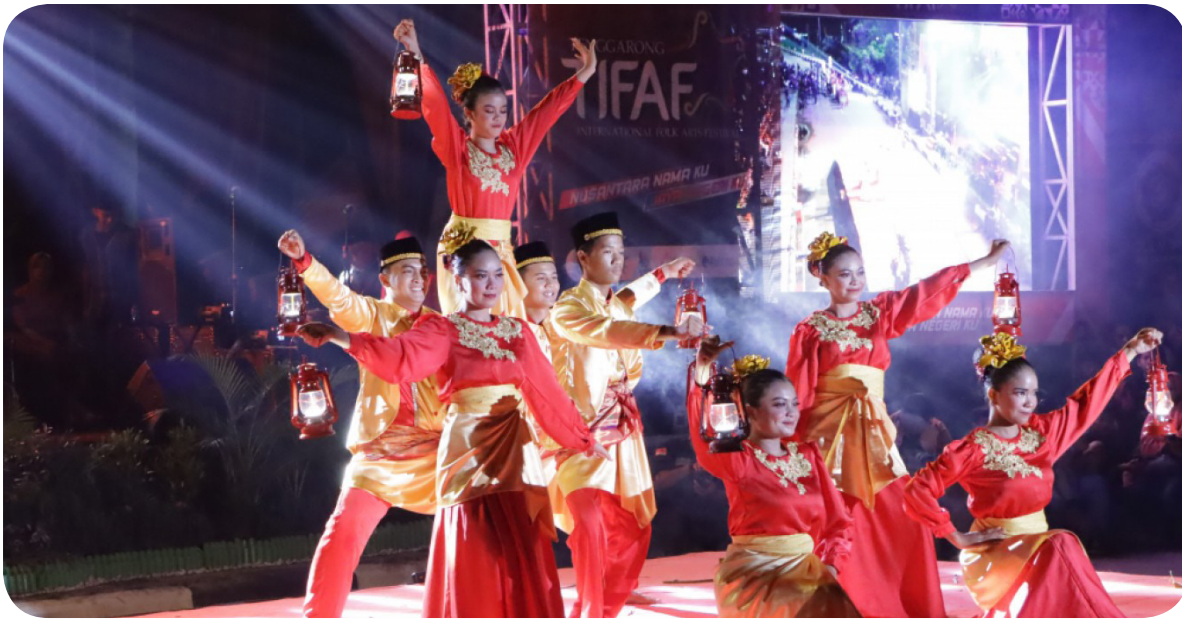
Pertunjukan tari saat pembukaan TIFAF 2023, Minggu (9/7/2023) malam.