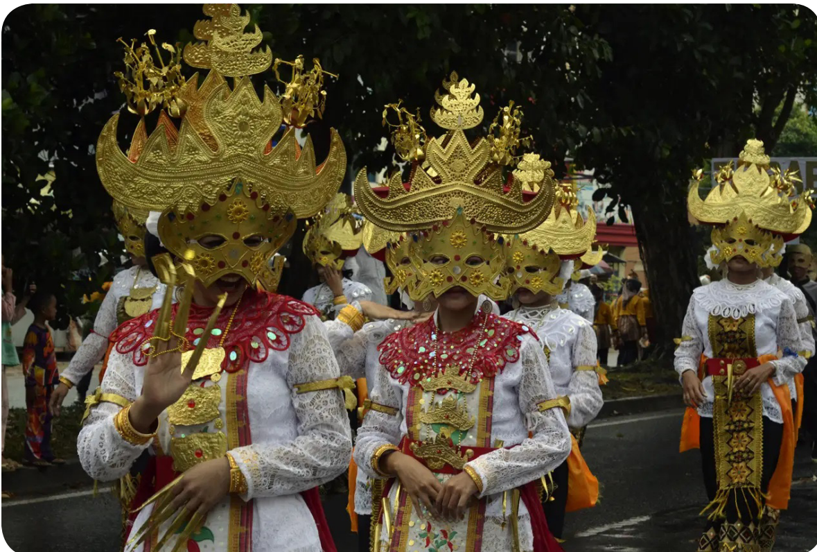
Peserta Karnaval Budaya Topeng pada Festival Krakatau 2023 di Jalan Sultan Agung, Kota Bandar Lampung, Lampung, Sabtu (8/7/2023).