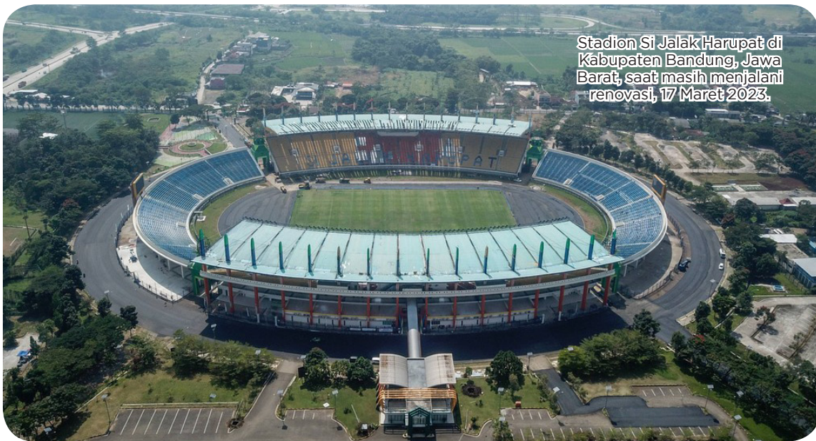
Stadion Si Jalak Harupat di Kabupaten Bandung, Jawa Barat, saat masih menjalani renovasi, 17 Maret 2023.