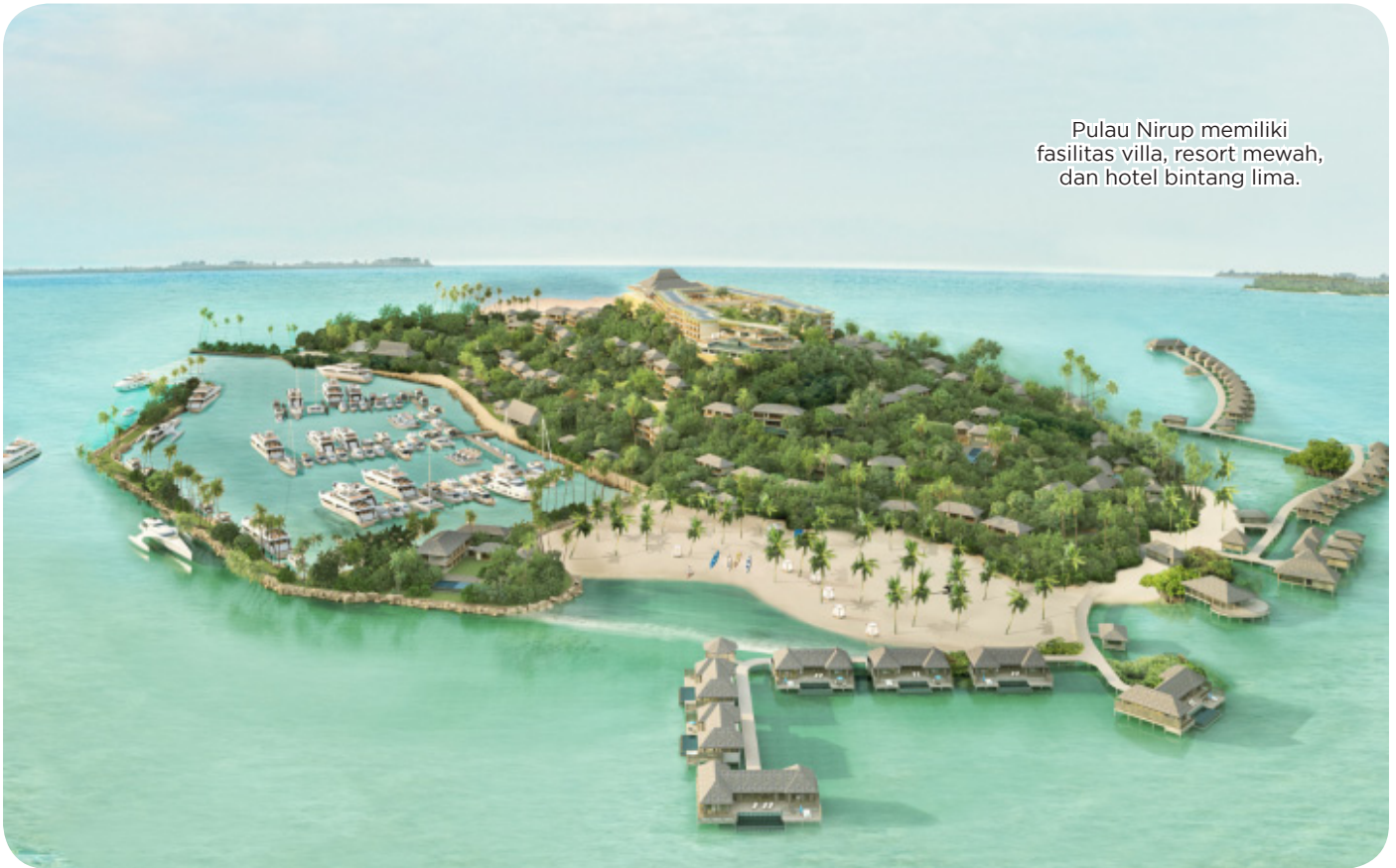
Pulau Nirup memiliki fasilitas villa, resort mewah, dan hotel bintang lima.