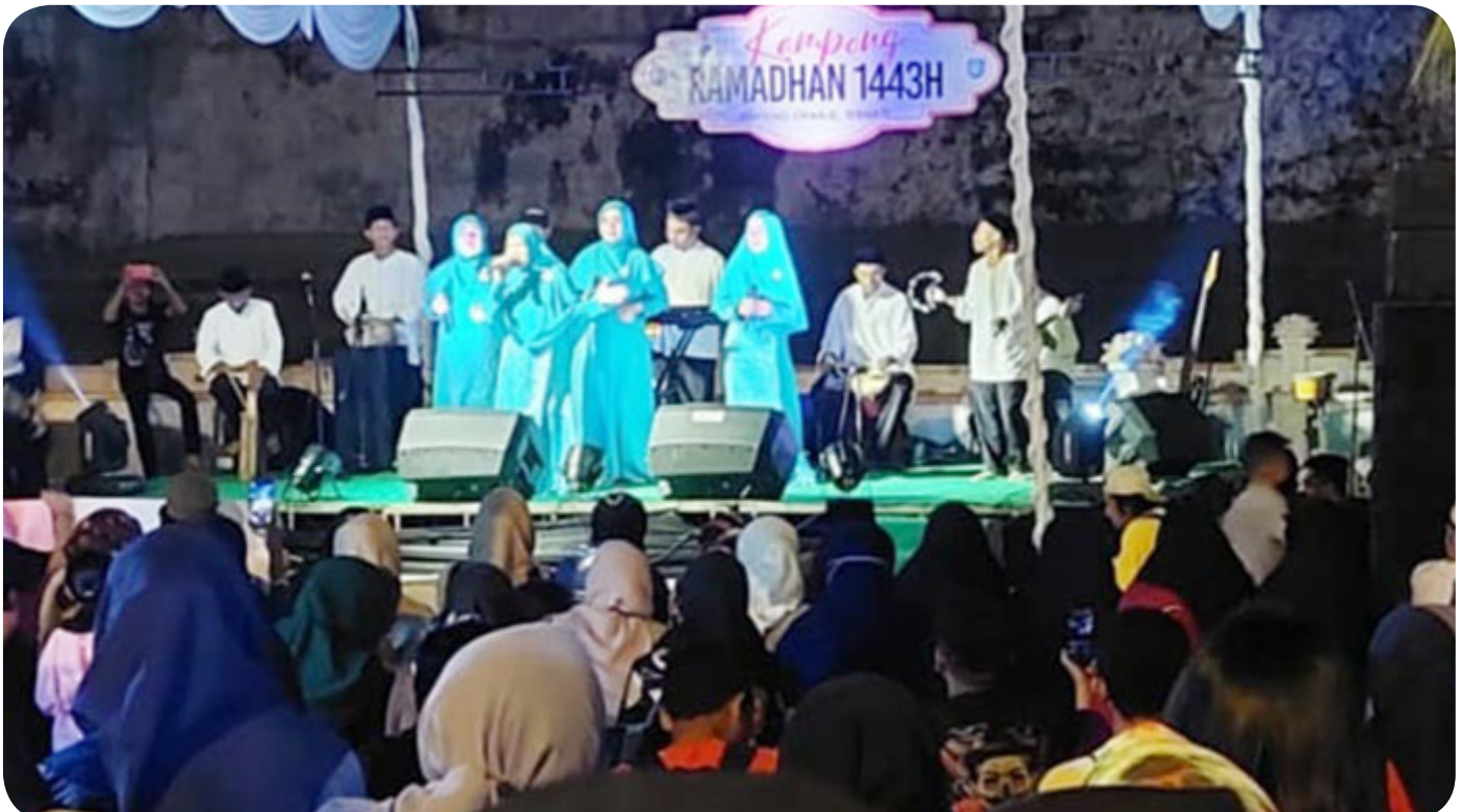
Tim gendang sahur asal Kecamatan Kota Ternate Utara (Camtara) yang menjadi juara pertama pada Festival Gendang Sahur 2022 di Benteng Fort Oranje.