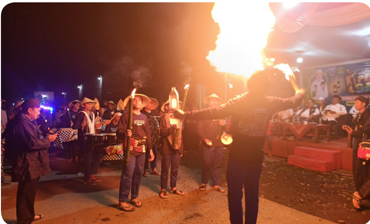
Penampilan salah satu peserta Festival Musik Pengantar Sahur di Probolinggo.