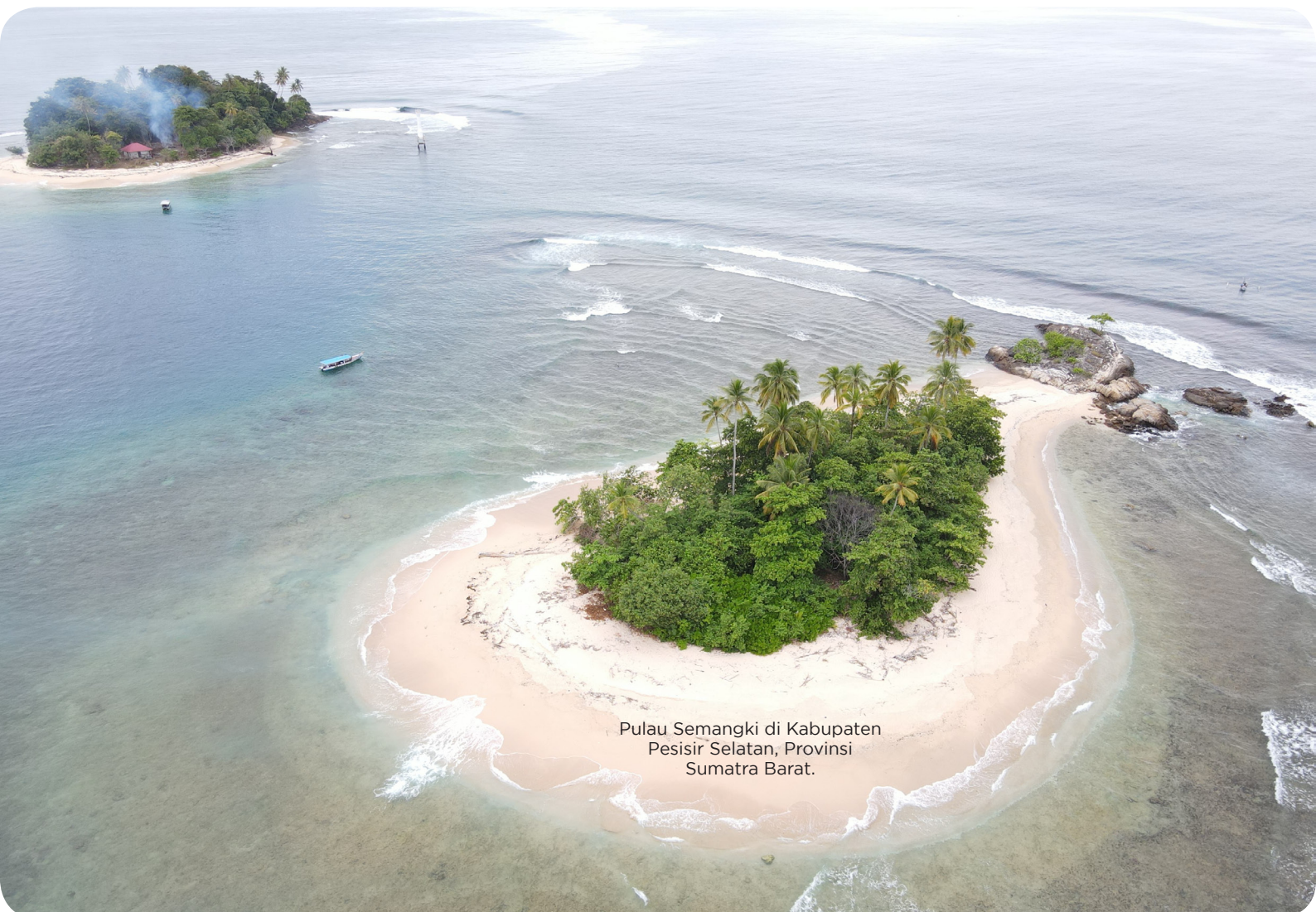
Pulau Semangki di Kabupaten Pesisir Selatan, Provinsi Sumatra Barat.

Di Pulau ini, Pemkab antara lain membangun cottage dengan bangunan semi permanen yang akan terpisah dari pulau, sepanjang 200 meter dan dihubungkan dengan jembatan apung. Mirip dengan destinasi wisata di Maldives atau Maladewa. Pemkab juga membangun jembatan untuk menghubungkan dua pulau itu. Alokasi anggaran sekitar Rp 300 juta. (en)