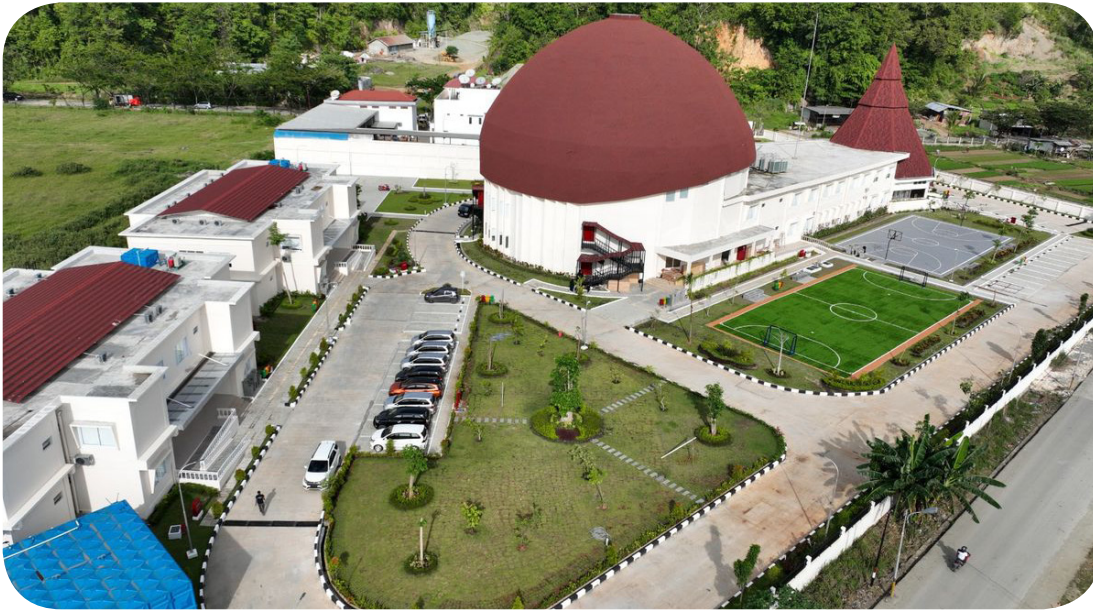
Papua Youth Creative Hub juga dilengkapi sarana olahraga.