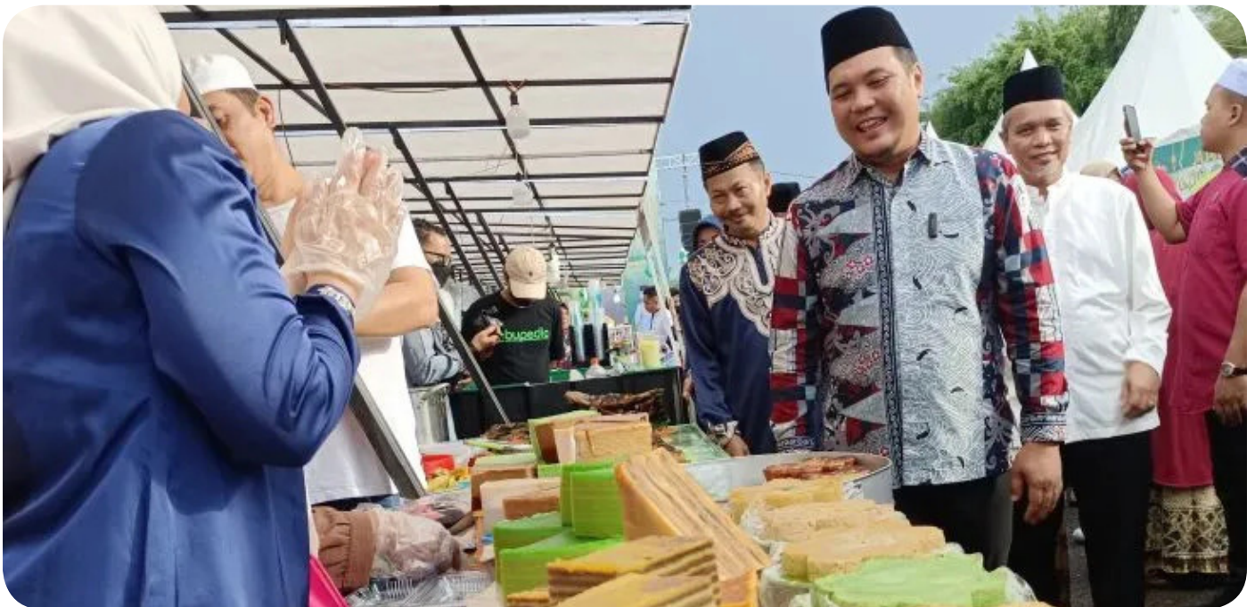
Wali Kota Banjarbaru M Aditya Mufti Ariffin bersama Wakil Wali Kota Wartono dan Sekkot Said Abdullah meninjau stand pasar wadai di Banjarbaru Ramadhan Festival 2023, Kamis (23/3/2023).

Banjarbaru Festival Ramadhan banyak menyediakan makanan dan minuman untuk berbuka puasa. Di antara takjil yang dijajakan kalepon, laksa, apam balambar (apem basah), pais sagu, bingka kentang, amparan tatak, dan lain-lain. Di antaranya beberapa makanan dan minuman yang hanya dijajakan saat bulan Ramadan. (en)