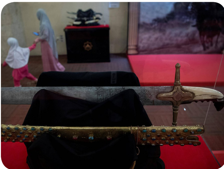
Artefak peninggalan Nabi Muhammad SAW dan sahabat yang dipamerkan di Masjid At-Tin, Jakarta Timur mulai 20 Maret hingga 14 April 2023.

Terdapat juga jenggot baginda Rasulullah SAW, helaian rambut, darah bekam, ekstrak keringat, tanah makam, kiswah makam, wadah air minum, tongkat. Bahkan bekas tapak kaki Nabi Muhammad maupun bekas kaki unta yang kerap kali dikendarainya. (ant/en)