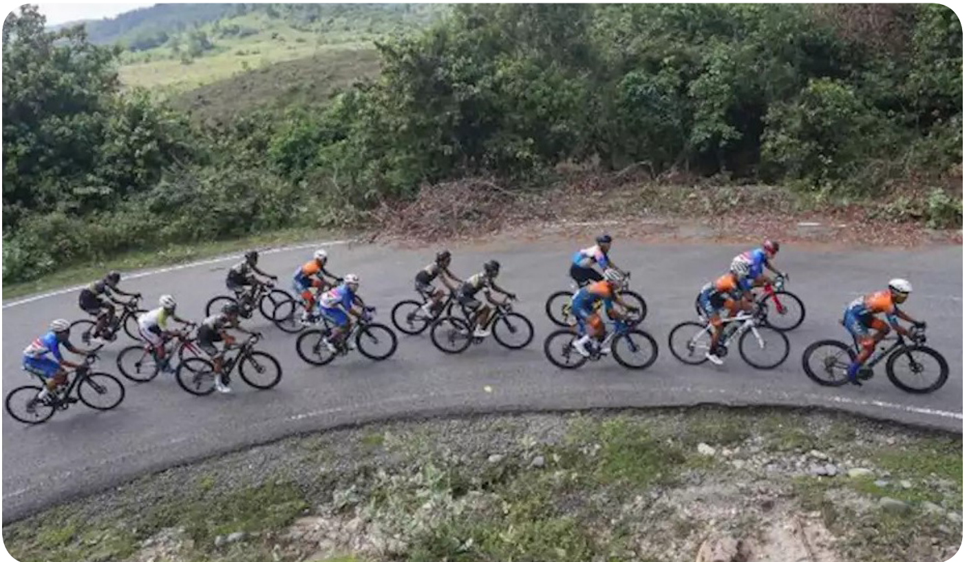
Pebalap saat mengikuti Tour De Aceh 2023 di Aceh Besar, Aceh, Minggu (12/3/2023). Balap sepeda Tour De Aceh menempuh jarak 99 kilometer yang diikuti sebanyak 315 atlet dari Aceh, Sumatera Utara, Yogyakarta, Jakarta, Jawa Tengah, Jawa Timur serta Malaysia dan Italia.

Masri menjelaskan pada kategori individual road race , peserta diberikan rute sejauh 99 kilometer yakni dari Banda Aceh-Aceh Besar, dimulai dari Pantai Ulee Lheue, Banda Aceh hingga finish di Lhok Seudu Aceh Besar. (en)