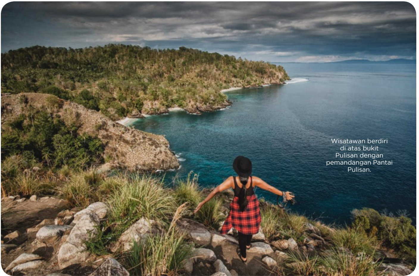
Wisatawan berdiri di atas bukit Pulisan dengan pemandangan Pantai Pulisan.