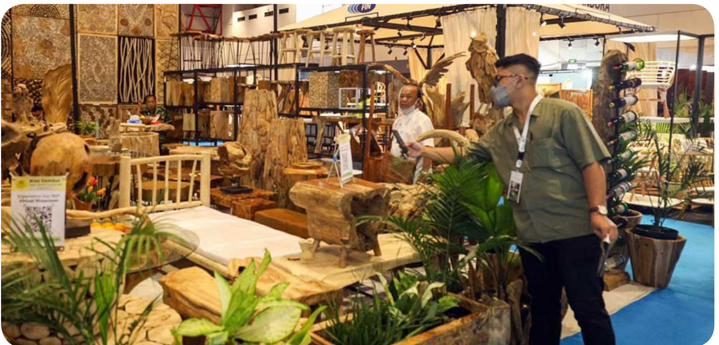
Selama 4 hari pelaksanaan, pameran IFEX 2023 berhasil menggaet lebih 12 ribu buyer.

Ia berharap dengan adanya pameran furnitur berskala internasional ini, para pelaku industri mebel tak hanya berkesempatan untuk memperkenalkan produknya kepada pasar lokal, melainkan juga pasar internasional. (ant/en)