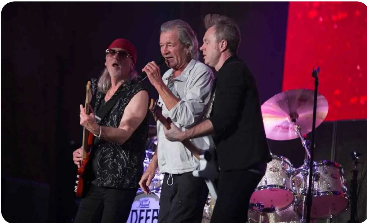
Vokalis Deep Purple Ian Gillan (tengah), bassis Roger Glover (kiri) dan gitaris Simon McBride tampil dalam konser "Deep Purple World Tour 2023", Jumat (10/3/2023).