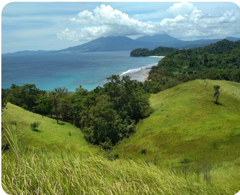
Bukit Larata dengan padang rumput ilalang.