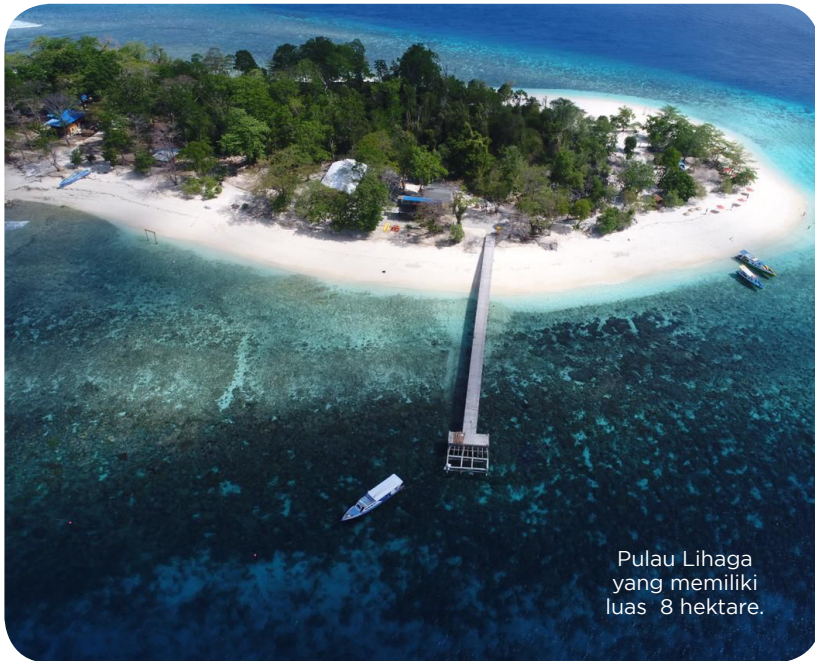
Pulau Lihaga yang memiliki luas 8 hektare.