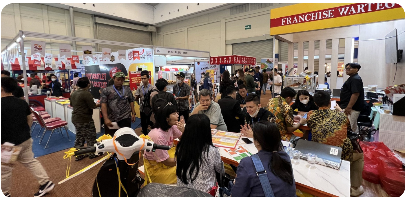
Suasana pameran IFBC 2023 yang berlangsung sejak Jumat (10/3/2023) hingga Minggu (13/3/2023) di ICE BSD Hall 1.

Setelah di ICE BSD, gelaran informasi bisnis waralaba ini akan kembali diadakan di empat kota lainnya, yaitu di Bandung pada Juni 2023, Palembang pada Juli 2023, Surabaya dan Banjarmasin pada September 2023. IFBC Expo juga akan diadakan kembali di ICE BSD pada November 2023. (en)