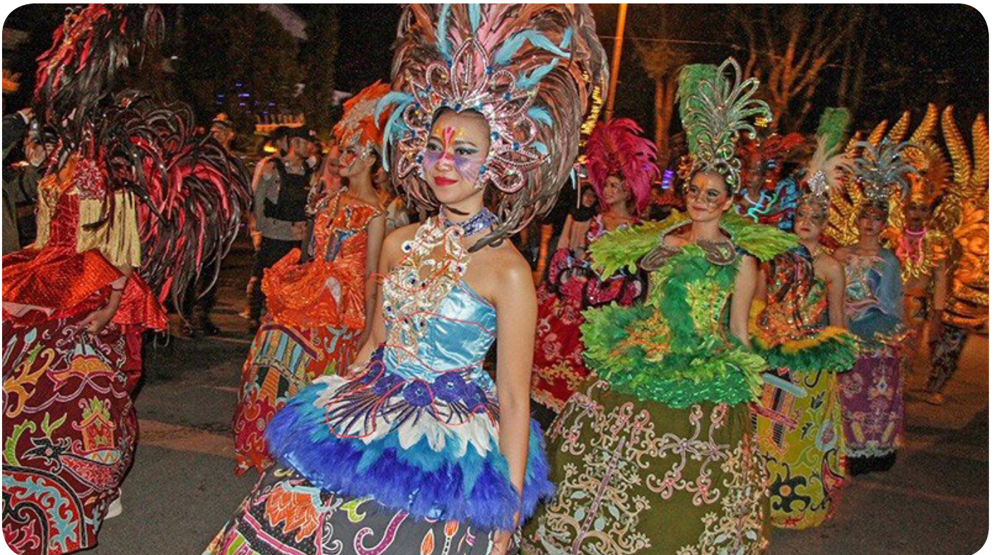
Sejumlah model mengenakan busana kreasi benang bintik khas Kalimantan Tengah saat parade busana benang bintik festival di Stadion Sanaman Mantikei, Palangka Raya, Kalimantan Tengah, Rabu (15/3/2023).