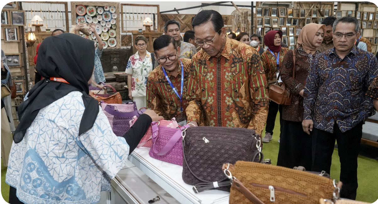
Gubernur DIY Sri Sultan HB X melihat produk-produk furnitur dan kerajinan yang dipamerkan setelah acara pembukaan JIFFINA 2023.