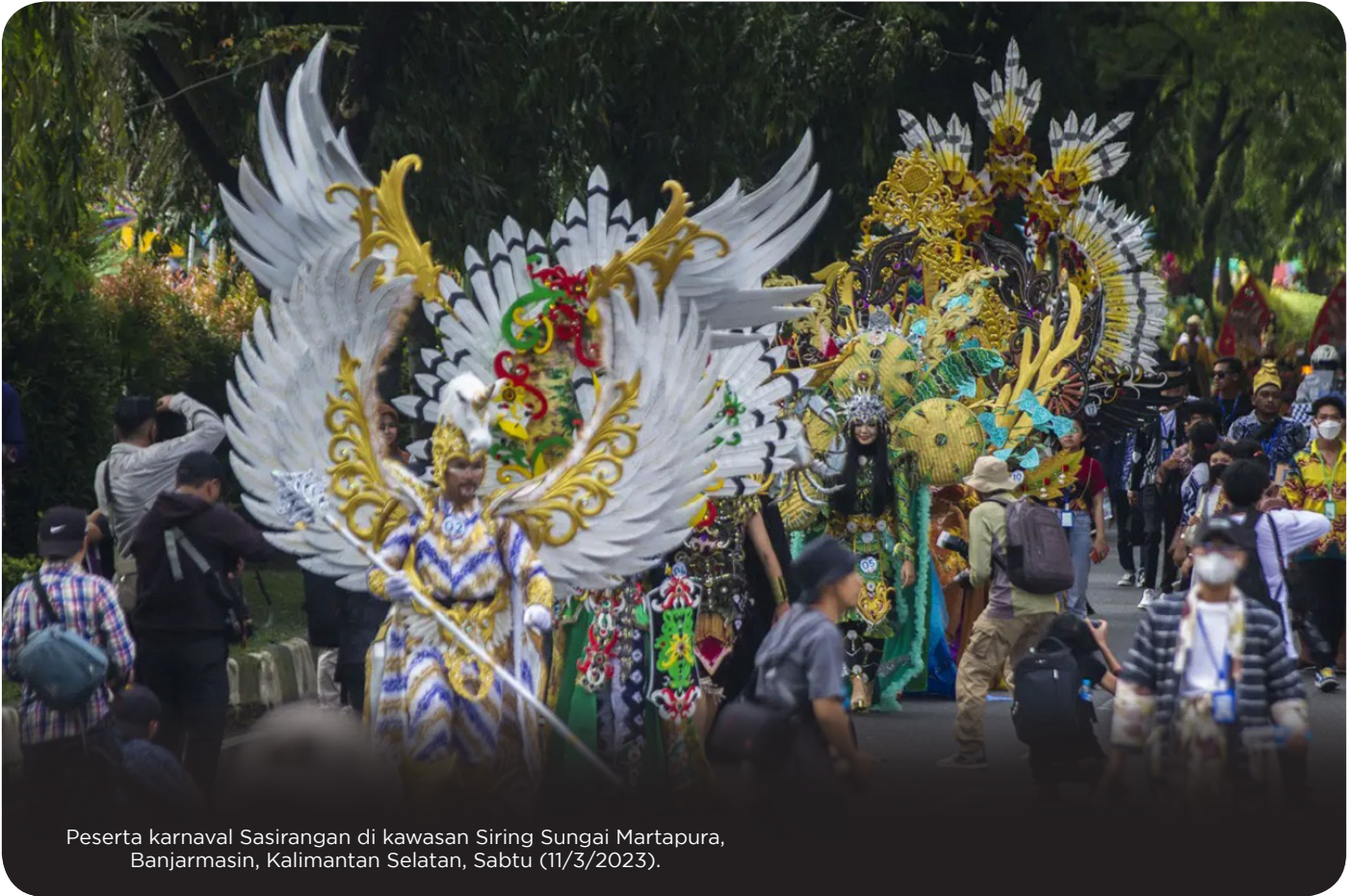
Peserta karnaval Sasirangan di kawasan Siring Sungai Martapura, Banjarmasin, Kalimantan Selatan, Sabtu (11/3/2023).